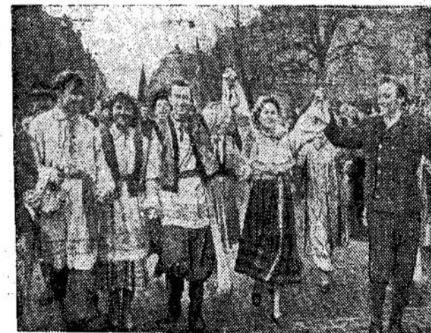
Vilniuje džiugiai buvo susaviveiklininkų koncertai. Nuotraukose: Šventės eisenos, šventinės eisenos.