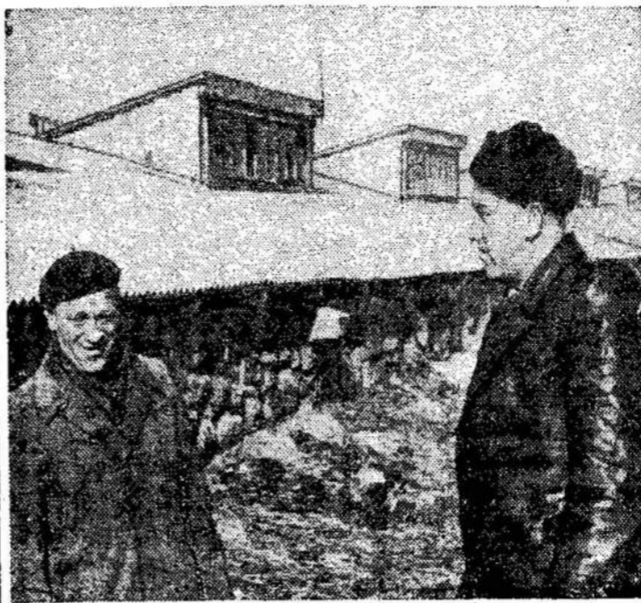
Varnių rajono "Kuršų" statyta iš akmens kolūkio nauja karvidė, pa-

Baimė, desperacija nieko niekad neišgelbėjo ir neišgelbės. Išsigandęs žmogus negalvoja. Atrodo, kad šiandien dauguma valstybių yra taip išsigandusios, kad nebegali reikiamai galvoti.