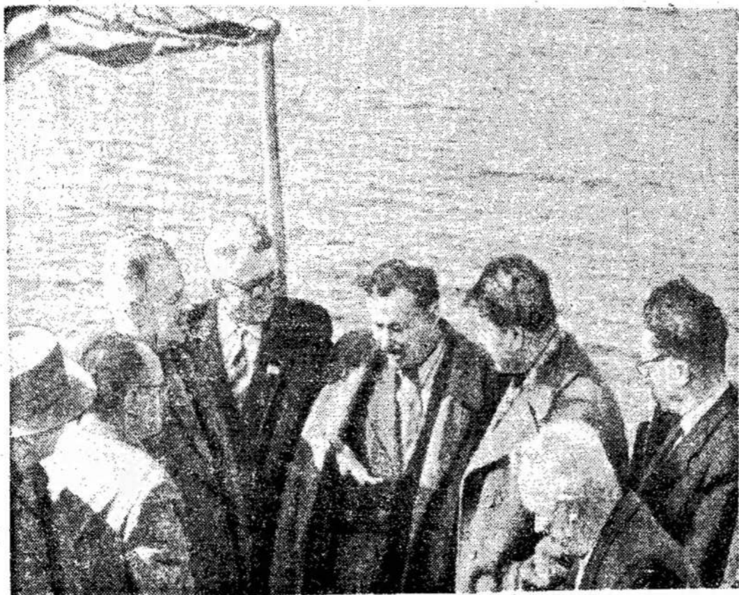
Pilnu pajėgumu palei Lietuvos Komunistų partijos vadovai su Kauno HES stadiant Kauno hidroelektrinę ir respublikos vyriausybės tytojais plaukia Kauno jūra.