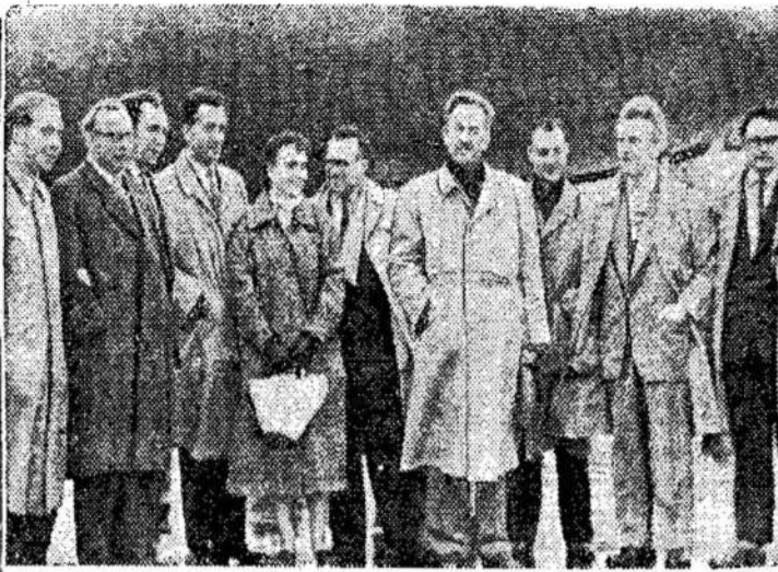
Čia matote grupę Lietuvos Federacijoje suruoštoje lietuvių tarybinės poezijos dekadėje.

Kaip galima kalbėti šandien apie kokį skurdą kaime, kada kolūkietis už savo gaminius gauna gerą kainą, kai