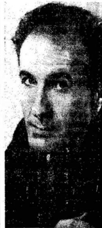
Barry Morse, veteranas aktorius ant steidžiaus ir televizijos, kurs dabar matomas vaidinant ant televizijos kas savaitę programoj "Presenting Barry Morse".

Pasekmės šių merginų pastangų nebuvo labai didelės. Tačiau davė šokių tokius rezultatus. 60 beclerių pasižadėjo vesti jų išrinktasias. Ar jie ištesės žodį, kada festivalio dvasia išgaruos, žinoma, visai kitas dalykas.