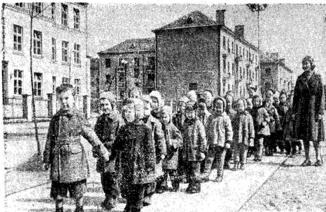
Vaidas iš Kauno hidrolektrinės statytojų gyvenvietės. Statytojų vaikai pasi-ly. Ten jų laukia skanūs pie-vaikščiojo ir grįžta į darže- tūs.