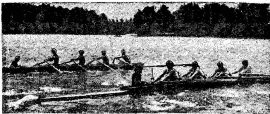
Irklavimo sportas Trakuose. Vasarą toks vaizdas labai dažnas gražuose Trakų ežeruose.

Rokiškyje įvyko respublikinis kraštotyros muziejų darbuotojų pasitarimas. Pasitarime buvo susumuoti kultūrinių įstaigų apžiūros, skirtos Tarybų Lietuvos dvidešimtmečiui, rezultatai. Respublikos Kultūros ministerijos nutarimu Rokiškio kraštotyros muziejui pripažinta pirmoji vieta ir įteikta Raudonoji vėliava "Geriausiai respublikos kultūrinei įstaičiai".