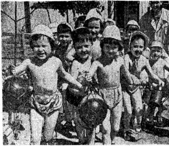
Kai šilta — visiems smagu. Vilniaus "Raudonosios žvaigždės" kombinato vaikų darželio auklėtiniai.