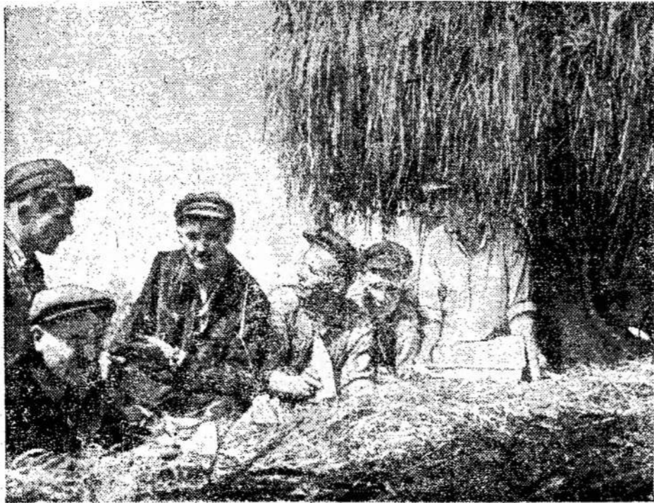
Sienu plovėjėliai valandėlę pailsi prie sienu pakranto sunkvežimio (Silutės rajonas, Sakučių tarybinis ūkis).