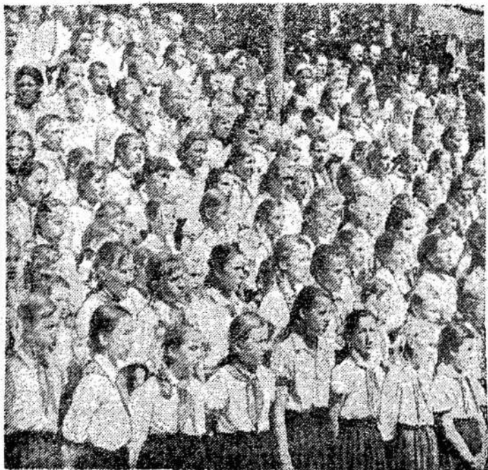
Aštuntoji Kėdainių rajono Dainų šventė. Pasirodo patys jauniausieji — 2-osios

Svečią sostinės aerouoste sutiko rašytojai ir respublikinės spaudos atstovai.