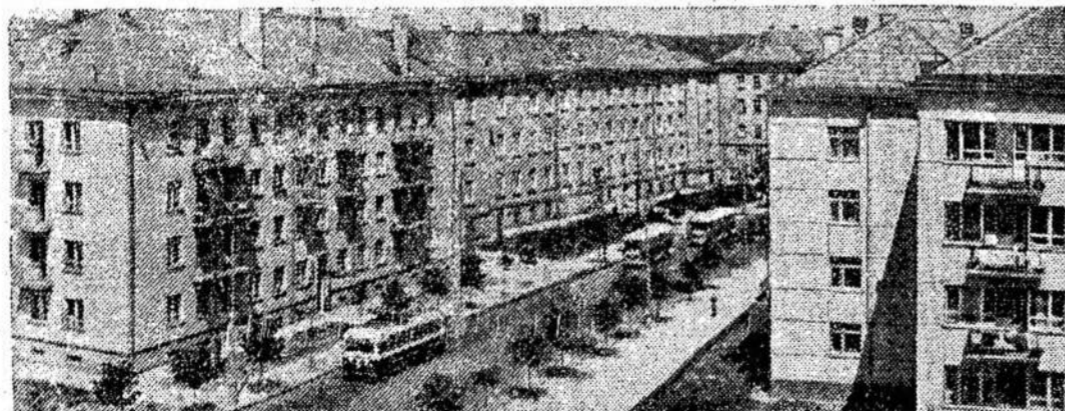
Štai kaip šiandien atrodo Antakalnis, kur anksčiau stūksojo mediniai namiūkščiai, vingiavo kreivos, duobėtos gatvelės.

Leopoldville. — Kongo respublika ruošia savo armijos dalinius pasiuntimui į Katanga provinciją.