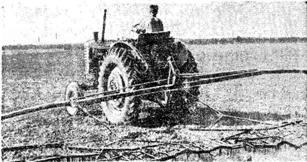
Eišiškių rajono "Pirčiupio" kolūkyje akėjami kukurūzų pasėliai. Nuotraukoje: traktorininkas Juozas Jankaitis kukurūzų pasėlių laukuose