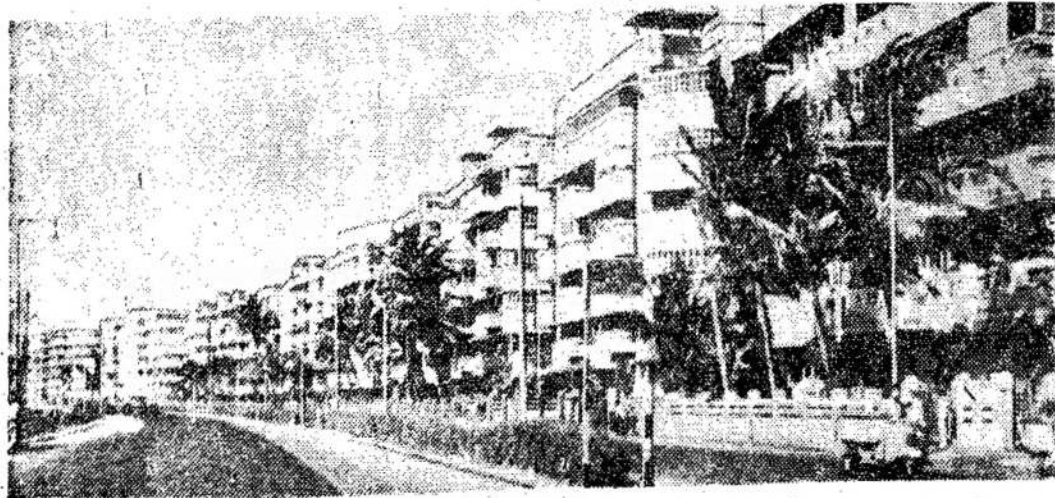
Bombėjus. Marin Draivo krantinė.

Kinija ir Kuba pradeda placius prekybinius ryšius.