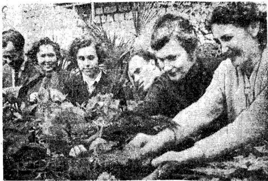
Tai Vilniaus siuvimo fabri- ko "Lelija" darbininkės. Jos monės gėlyne išaugina tiek gėlių, kad jomis pakanka pa- puošti kiekvieną fabriko sky- rių.