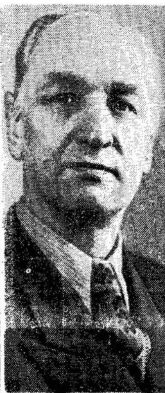
Lietuvos TSR Aukščiausiosios Tarybos Prezidiumo Pirmininkas Justas Paleckis, kurs pastaruoju metu lankėsi Japonijoje. Jis vadovavo Tarybų Sąjungos delegacijai tarptautinėje parlamentarij konferencijai Tokijo mieste.

Kolūkis teikia savo nariams visokeriopą paramą. Kaip visur, taip ir pas mus buvo ir dar yra tokių kolūkiečių šeimų, kurios niekada neturėjo nuosavų namų. O ką reiškia turėti nuosavus namus, gerai žino tik tas, kas