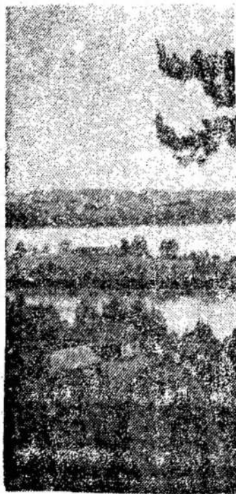
Gimtosios žemės vaizdelis. Ginučių ežeras, Ignalinos rajone.

Dabar aš supratau. Žiūrėti į sustingusį, kokios tai nepaprastos rimties sukaustytą kolūkie "Cerniakovskis" šoferio veidą aš supratau, kad toliau jo klausinėti nedera. Tai turėjo būti kažkas tokio, kas liečia ir šio paprasto tarybinio žmogaus šventus jausmus. O gal ir kiekvieno doro lietuvi šven-