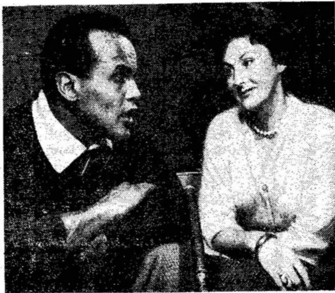
Liaudies dainų dainininkas Harry Belafonte kalbasi su rikos politiką, savo planus pagaminti filmą apie poetą Puškina.