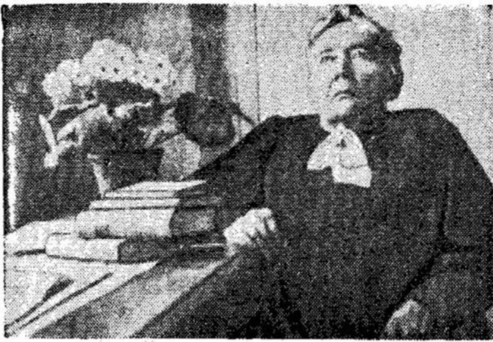
G. Petkevičaitė - Bitė