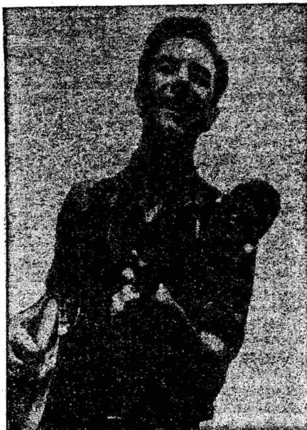
Peter Seeger, amerikietis, ragangaudžiū klausimus, liaudies dainų dainininkas, ar jis buvo kada komunistas, kurį nuteisė metams kalėjimo už atsisakymą atsakinėti Kanadoje.

Tame ir glūdi visa bėda. Vakarai nori pasilaikyti tą jėgą, bet tuo tarpu jie reikalauja organizuoti visokią in- spekciją dėl kokio nors mažo susitarimo. Pavyzdžiui, jie nori plačios inspekcijos ir kontrolės prižiūrėjimui susita- rimo nėdaryti nuklinių bandymų, kuomet nei nemanoma apie nuklinių bombų panaikinimą. Kas gali prisiimti tokį šnipinėjimą be nusiginklavimo.