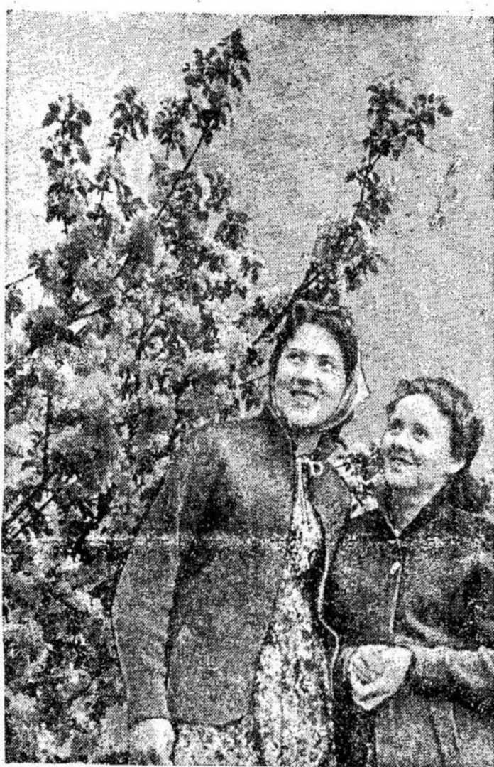
Kai gimtojoj žemėj sodai žydi...

Čia, susirinko Tarptautinė Kontrolės Komisija, kurią sudaro Indija, Kanada ir Lenkija. Ji paruošianti raportą, kaip ji turėtų veikti Laosoj. Visi trys sutaria dėl plano, tik nežinia, kaip bus galima įgyvendinti, kadangi kariaujančios pusės dar nepertraukė mūšių.