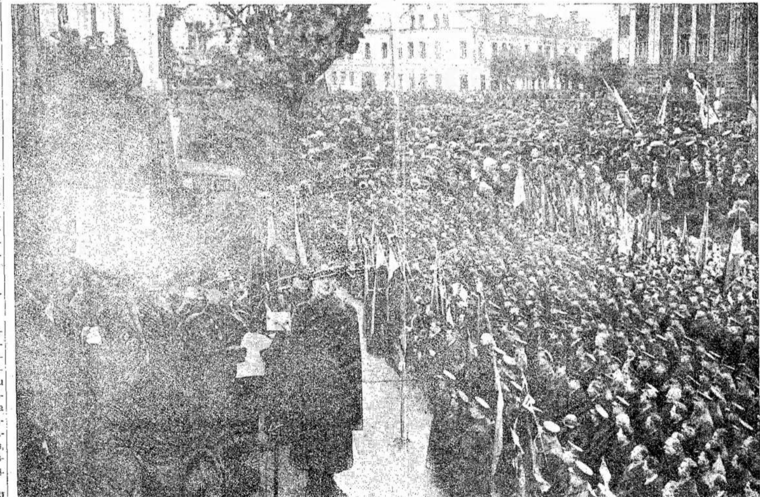
"Susilaukėmė!" — D a l i s je matyti dalis organizacijų vė-džiungsmo manifestacijos spalų 11 dieną, susirinkusios pas Res-publikos Prezidentą sostinės Vil-niaus gražinimo proga. Dešin-

Baigiant tenka pažymėti, kad dabartinis Jungtinių Valstijų prezidentas Rooseveltas žengia Vilsono pramintu taku. Dabar-tinio Europos karo atgarsiai čia tokie pat, kaip ir 1915 me-tais. Karo klausimu Jungtinėse Valstijose istorija kartojasi.