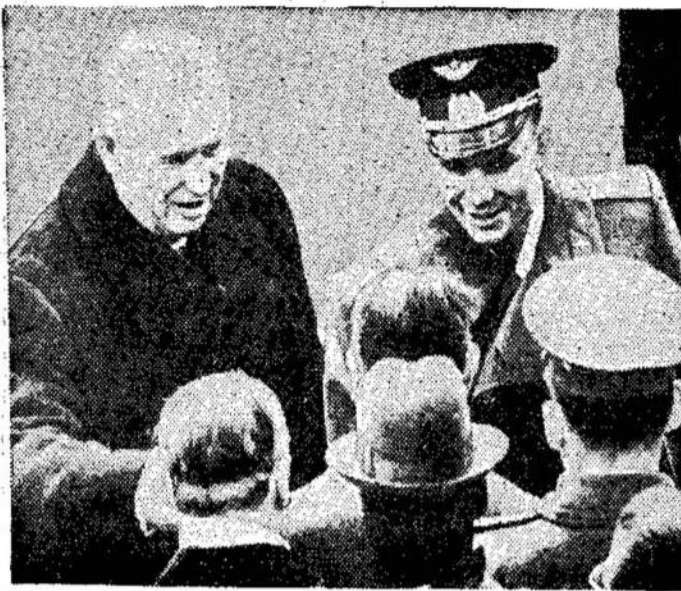
Pirmasis pasaulyje kosmonautas, Tarybų Sąjungos Didvyris Jurijus Gagarinas, po laimingos kelionės kosmose, sutinkamas Maskvos aerodrome. Nuotraukoje matome Tarybų Sąjungos Vyriausybės vadovą Nikitą Chruščiovą sutinkant Jurijų Gagariną.