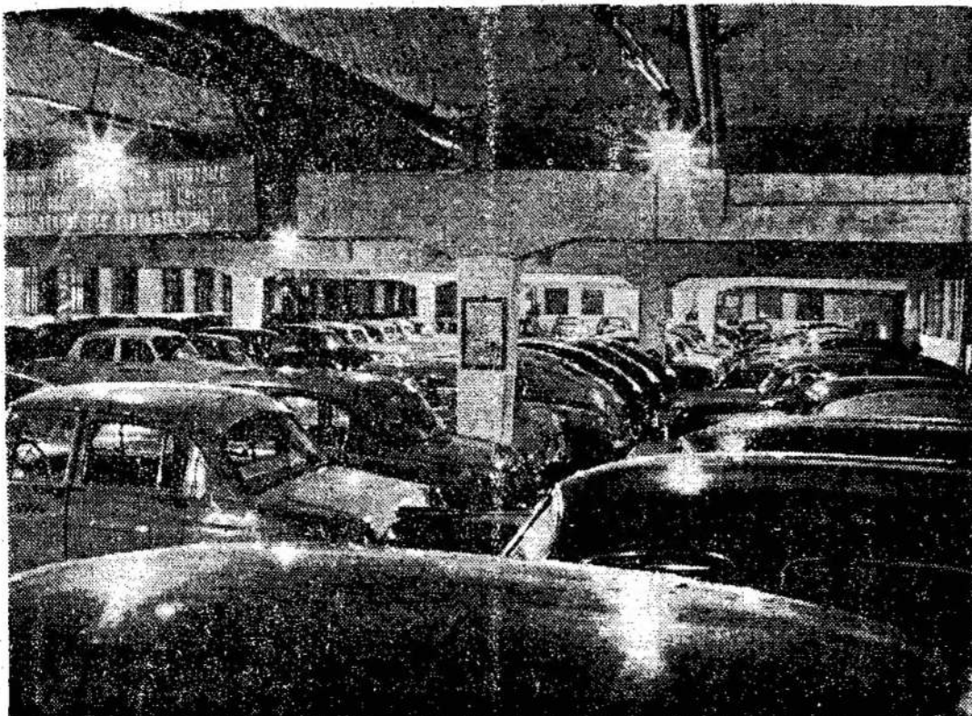
Vis plačiamas Vilniaus mies to taksi parkas. Čia matome taksi mašinas garažo ant-rajame aukšte.