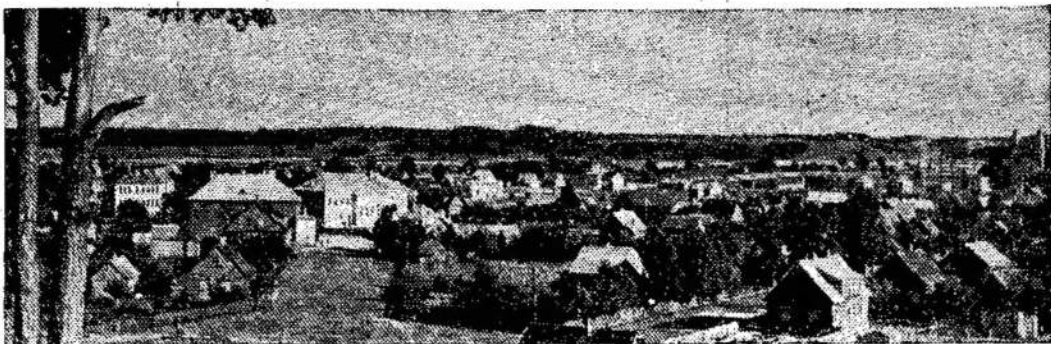
Jonavos bendras vaizdas. (Nuotrauka daryta 1960 metų vasarą.)