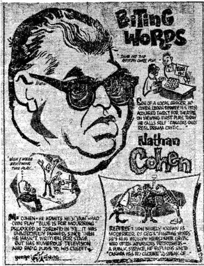
Reproduced from "O Canada" with permission of the artist

Kaip šlykščiai atrodys, kad mylimiausi jos tėvai nesakė jai tiesos.