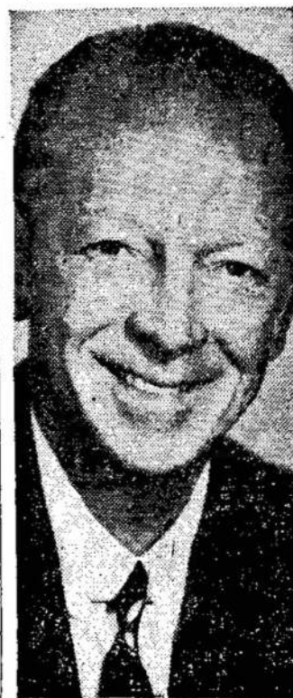
Veteranas sporto pranešėjas ant radio Red Barber, kuris paskirtas pranešėju naujoje programoje "Sports-A-Rama".

Tiktai trockistai ir kiti sektantai smerkia tokią taktiką. Girdi, kam tos reformos, jei jos ne silpnina, bet tvirtina kapitalizmą. Pirmiausia, sako jie, reikia nuversti kapitalizmą. Bet tai seniai sveiko proto sugriauta teorija. Viskas turi ateiti savo keliu. Žmogui reikia gyventi, valgyti, apsirengti. Tad pirmoj vietoj šie klausimai