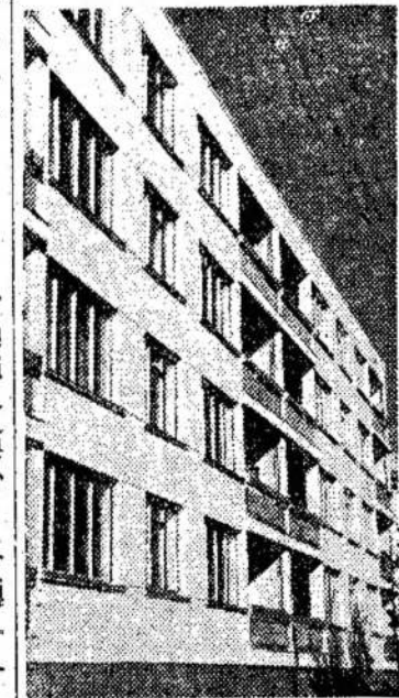
Nuotraukoje: nauji gyvenamieji namai Vilniuje, Žvėryne.

Dainų ir šokių liaudies ansambliai, chorai, šokių rateliai, įvairūs orkestrai, meninės agitbrigados, solistai, skaitovai šių koncertų metu pademonstravo savo išaugusį meninį lygį, įrodė, jog jie papildė savo repertuarą naujais, dabartės gyvenimą atspindinčiais kūriniais.