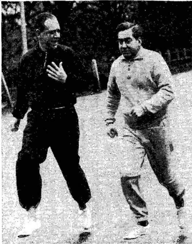
Britų komikai Sid James ir Tony Hancock, kurie matomi ir ant Kanados televizijos. Jie bus girdimi ir ant radio penktadienio vakarais vasaros metu. Jie moka juokinti žmones.

LISBON. — Čia gelžkelio stotyje luboms nupuolus ant žmonių, 50 asmenų buvo užmušta ir 36 sužeisti.