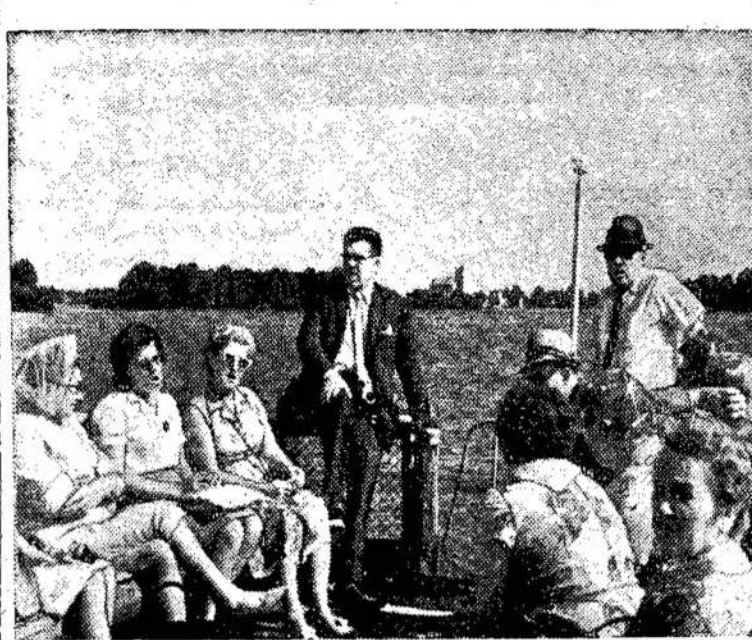
Kanados lietuvių turistai traukia garlaiviu Trakų ežerais. Džiaugdamiesi puikiu oru ir nepamirštamais Trakų vaizdais, traukė dalną po dalnos.

Amerikiečiams kainuoja virš $1,000,000 į dieną šio režimo išlaikymas. Bet nematyti galo. Diemo valdžios jėgos, kurioms padeda 15,000 amerikiečių, kol kas nesugebėjo sumažinti partizanų aktyvumą.