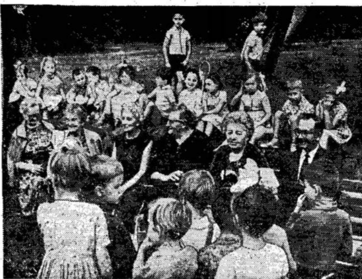
Bostono lietuviai svečiavosi vasaros vaikų darželyje Valakumpiuose, Vilniuje.

Matė, kaip šalis keliama iš skurdo, kaip keliama žmonių gerovė.