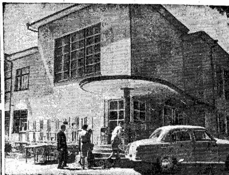
Lietuvos prekybos darbuotojų profesinės sąjungos poilsio namai Šiluose, netoli Vilniaus.

Jungtinių Valstijų senato komitetas santykiams su užsieniu 16 balsų prieš 1 pasisakė už ratifikavimą Maskvos sutarties sulaukymui nuklinių bandymų be jokių rezervacijų. Toks šio komiteto pasisakymas veikiausiai reiškia tą, kad ir senatas didėle didžiuma užsulaikymui nuklinių bandymų girs tą sutartį.