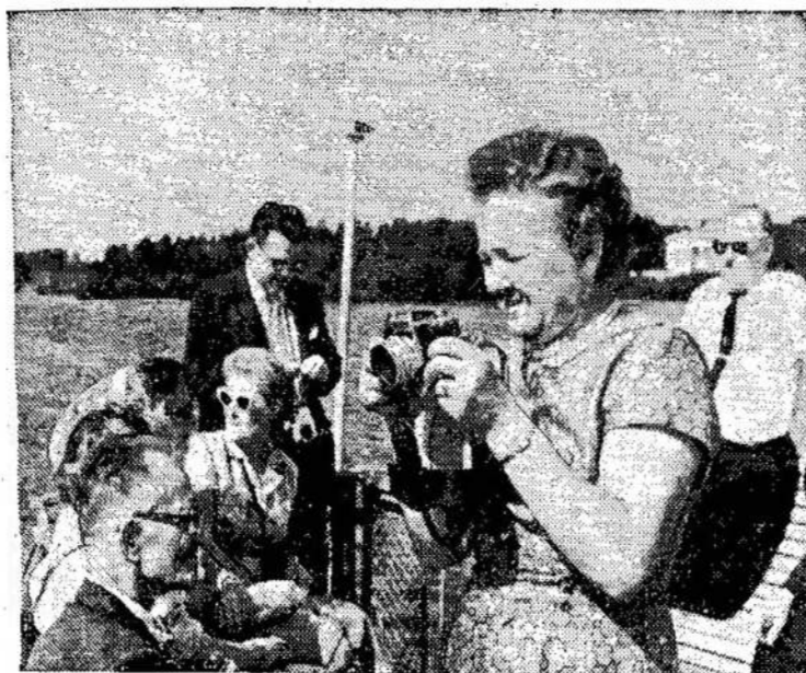
Kanados lietuviai turistai skuba fotografuoti Gulbės ežero vaizdus.

"Visus juos prisimindamas, siunčiu visiems labas dienas ir geriausius linkėjimus sėkmės jų darbuose ir laimės gyvenime. Man teko girdėti iš pažangių Kanados atstovų, kuriuos sutikau Maskvoje, kad nors lietuvių esą Kanadoje nedaug, bet jie esą aktyvūs pažangiamu judėjimu. Tai buvo irgi malonu girdėti apie savo tautiečius, kurie savo daugumoje yra darbo žmonės ir supranta, kad tik per pažangiausių idėjų laimėjimą darbo žmonės ir visa žmonija