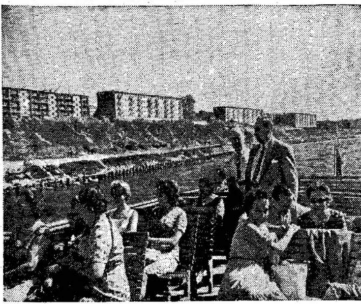
Kanados lietuviai turistai plaukia upe Vilniuje į Valakumpius. Juos veža atviras garlaivis.