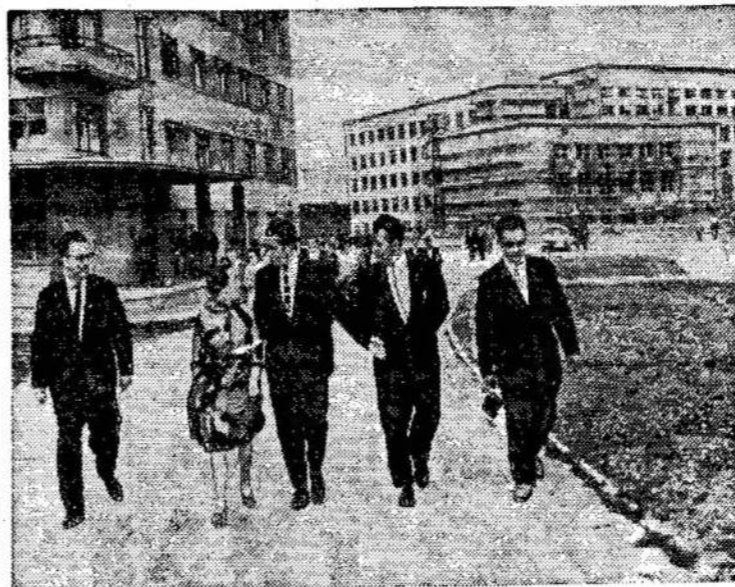
Lietuvos Žemės ūkio akademijos miestelyje Noreikiškėse Kaune