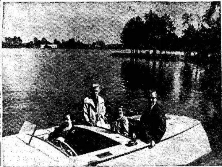
Bostoniečiai Galvės ežere smagiai pasivažinėjo kateriu. Tikrai puiki viešnagė istoriniuose Trakuose!

PARYŽIUS. — Francijos komunistai reikalauja, kad valdžia užgirtų Maskvos sutartį