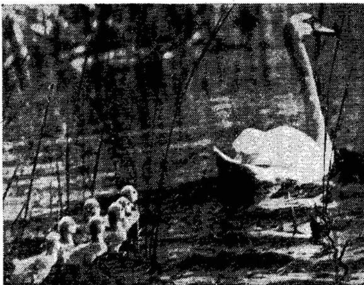
Žuvinto ežero idilija.