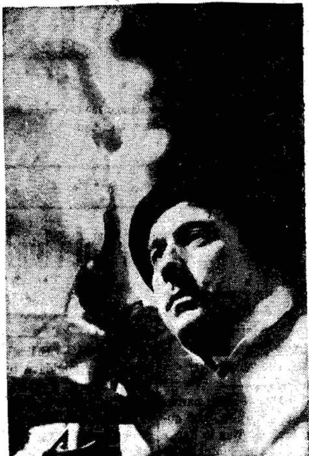
Žymus Lietuvos skulptorius, Lenininės premijos laureatas, Gediminas Jokūbonis darbo metu.