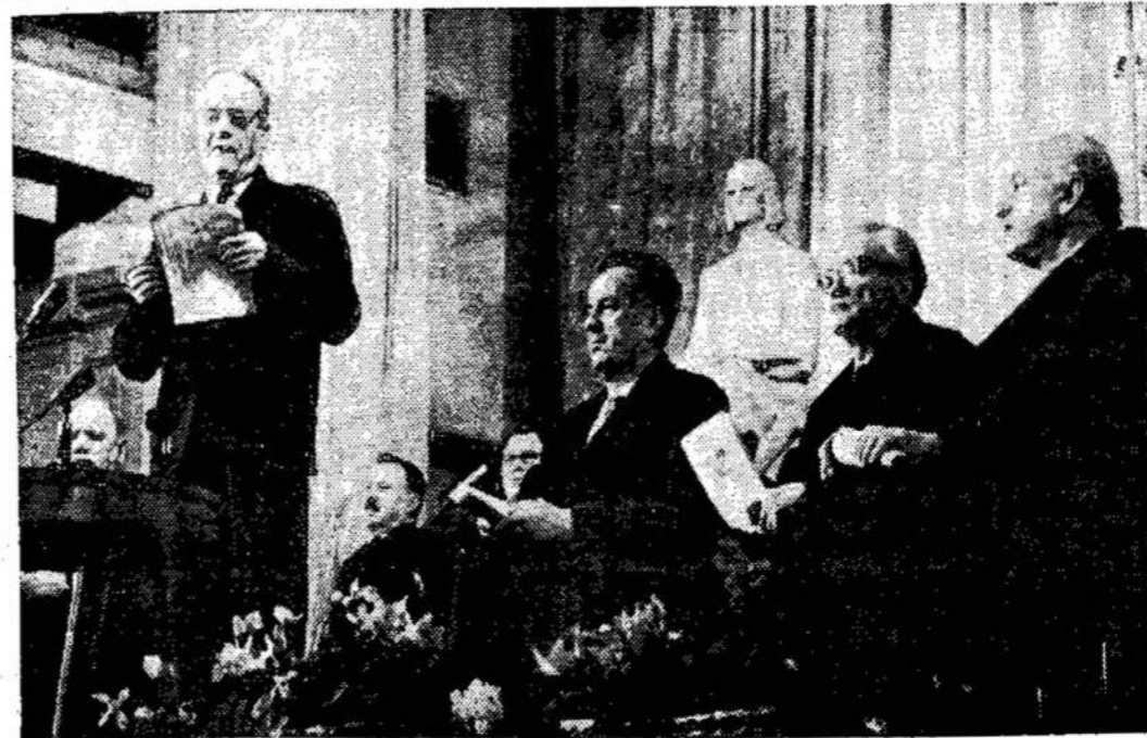
K. Donelaičio 250-ųjų gimimo metinių minėjimas Vilniuje. Iškilmingo minėjimo pradžioje — Lietuvos TSR

Liaudies Balsas, 160 Claremont St., Toronto 3, Ont. Canada.