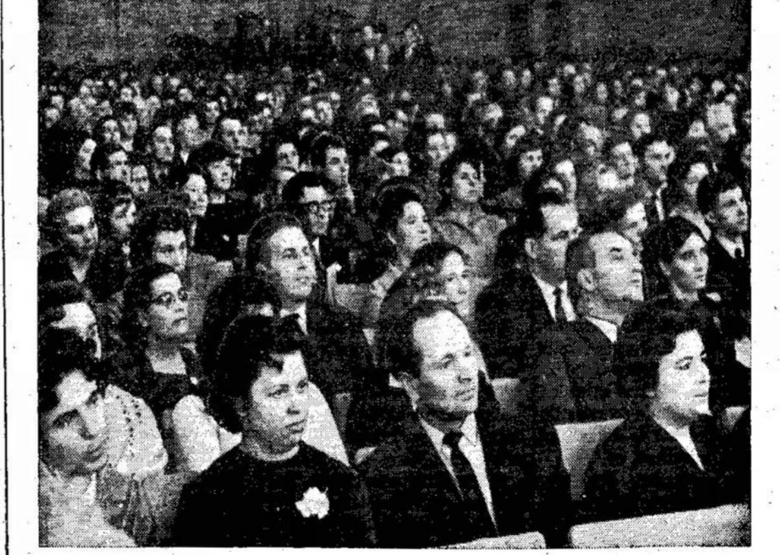
Šimtai vilniečių susirinko į paminėti įžymiojo jubiliejaus gimimo metinių. Nuotraukoje Valstybinės Filharmonijos salė — Kristijono Donelaičio 250 dalis susirinkusiųjų.

A. Bačiuris Atėjo naktis, niuje apsup naktis. Netgi gan kiečius. Vi liūtis. Miestas je. Bet tary blokavo išli mo židinius. Pėstinink: niršę. Jie už my stogų i vapavų liūd natomis ir gamuoju sk Basanavi gyvenamojo pėsi apie š šistai organ ba, ir iš č sunku išrū grupė su vy Solovjovu i žė tamsoj i i hitlerinink lėjo keletą muoju sky. Po kiek lai draskydami čius drabuž gus i kiem nelaisvę. Visur bu sipriešinim kiečiai ypa kibę i kiek bažnyčių aikščių me Kas valau tis darėsi v kiečių grup šintis. Kaip belaisvių p hitlerininku bijojosi at piktadaryb torijoje. Ji po vieną siausties. Tuo tarf buvo visis Begaliniai nervus, ka dėtis. Mieste č nės, kai 14 mendanto riui buvo garbingas prasibraut dimino ka bokšte — niaus past donają vėli Būriui v Andrianov: labai ištv komjaunir Kariauti jo apsnigt kuose. Iš t divizija jis Buvo suže: ninę. Vos pasivyti se i mūsų. Kle skaičiuosi. Tylos va