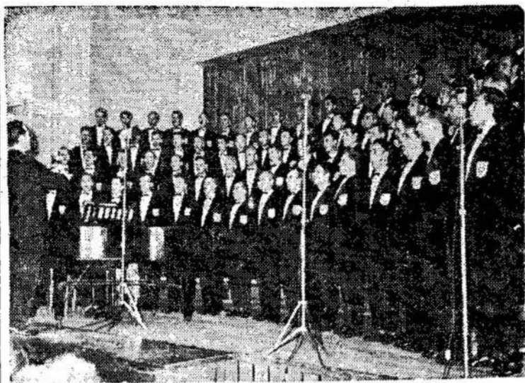
Kauno pramonės statybos projektavimo instituto vyrų choras — vienas geriausių Lietuvoje.

Esą plaučių vėžiu daugiausia serga išsiskyrusieji, divorsuoti, nežiūrint to, ar jie rūko, ar ne.