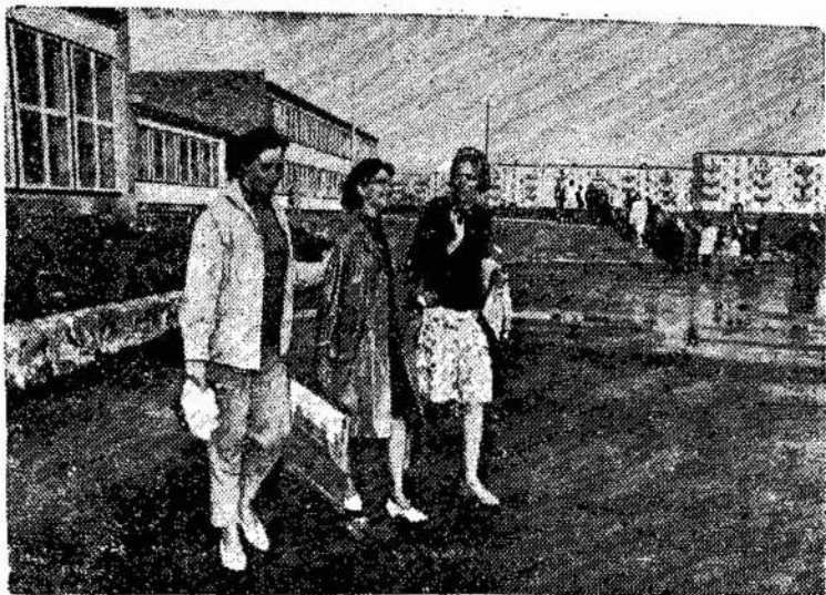
Elektrėnų miesto gatvėje