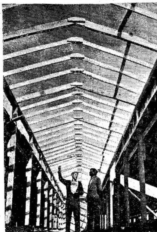
Kapsuko rajone Černiakovskio vardo kolūkyje statoma moderni kiaulidė, kurioje tilps 300 kiaulių.

Gali klerikalai girtis kiek tik pajėgia, bet istorija gerai žino, kad ne jie pažangai tarnavo. Ne kas kitas, o jie degino mokslininkus ant laužo už skelbimą tikro mokslo, tiesos. Taip yra ir šiandien. Jei tik kas iškels ką pažangesnio, tai tuoj visa dvasiškija, su mažom išimtim, pasmerkia. Praeina dešimtmečiai, kol būna priimtos pažangios idėjos. Reikia kritikuoti tuos, kurie daugiausiai priešinasi pažangai, o ne tuos, kurie visuomet buvo ir yra pažangos priešakyje.