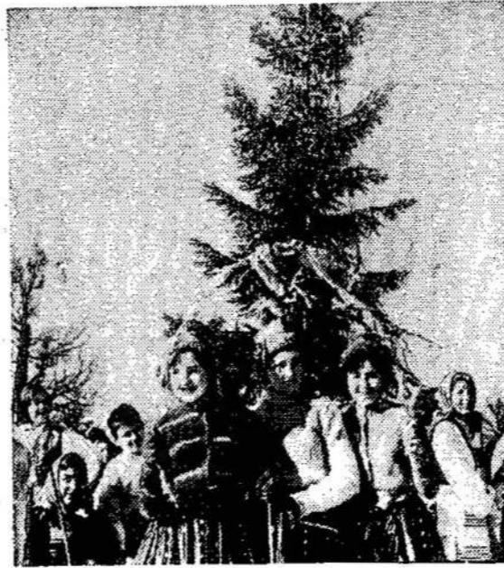
Žiemos šventė Kaune.

J. Kardelis tur būt negalėtų gyventi, jeigu jis nesurastų ko nors "bloga" Lietuvoje. Kiekvienam numeryje vis kai ką naujo išgalvoja. Pastarajame jis pravirko dėl Lietuvos jaunimo. Girdi, Lietuvoje "okupantas naudoja visas priemones lietuvių tautą sunaikinti. Ypač puola jaunimą: nutautina per mokyklas, vaikų darželius, specialiai tam tikslui steigiamus mokyklų namus; per prievartinį kariuomenės atlikimą rusų daliniuose, išvežant jaunimą į Rusijos ir jos užgrobtų sričių gilumą, kur kitaip negalima susikalbėti, kaip tikrai rusiškai; sąmoningai palaikant ir proteguojant lenkų ir gudų mokyklas Lietu-