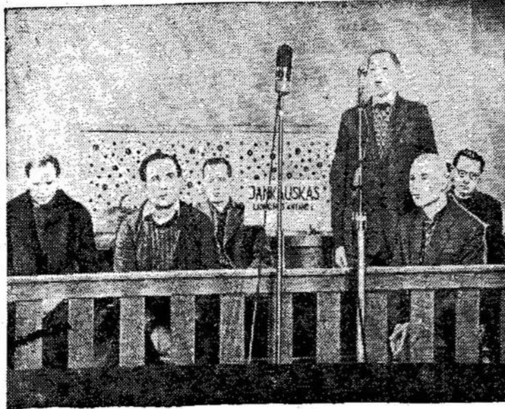
Buržuazinių nacionalistų, vokiečių okupacijos metais siautėjusių Skuoda apylinkėse, teisminis procesas. Nuotraukoje: kaltinamųjų suole.

DAMASKAS. — Sirijos saugumo organai praneša, kad jie susekė centraliniuose Sirijos rajonuose dvarininkų feodalų ruošiamą ginkluotą sąmokslą nuversti valdžią.