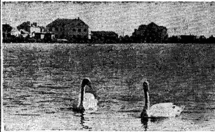
Šakiai — miestas prie ežero