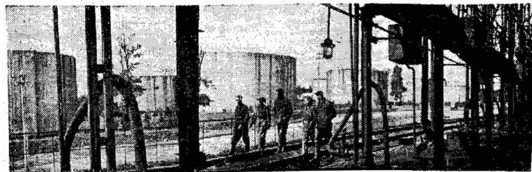
Klaipėda. Naftos perpylimo bazė

Vien tik Prancūzijoje kasmet dingsta 30,000 žmonių. Paryžiaus policija gauna kasdien po 40 pareiškimų apie dingusius asmenis: žmona prapuolė iš namų, tarnaitė negrįžo į darbą po sekmadienio, gerbiamų žmonių dukterė dingo pakeliui į universitetą, ir t. t. Policija dalį jų suranda. O koks likusiųjų likimas, ypač jaunų moterų ir mergaičių? Manoma, kad per pastaruosius 10 metų žmonių prekybos aukomis tapo apie 300,000 asmenų iš įvairių Europos kraštų. Tuo verčiasi gangsterių organizacija, biznio pasaulyje vadinama "Mėsininkų klubas".