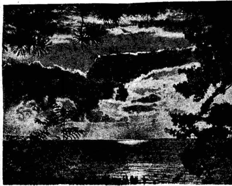
Baltijos jūra žiūrint nuo kranto

Reikia mokėti savo gimtą kalbą, bet čia gyvenant nei kiek nemažiau svarbu mokėti tą kalbą, kuri visų yra naudojama. Ji reikalinga ant kiekvieno žingsnio. Savo kalba gera tik tarp savųjų, o vietinė visur ir visame kame.