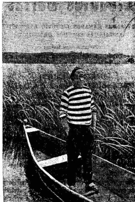
Lenino premijos laureatas poetas Eduardas Mieželaitis poilsio valandas praleidžia prie žavaus lietuviško ežero.

O dabar ultravioletinė radiacija turi svarbią reikšmę biologijoje, zoologijoje ir kt. Tarybiniai mokslininkai šiuo svarbiu klausimu yra atlikę nemažai bandymų Leningrade, Maskvoje, Minske, Lvove, Uzbekijoje ir kitur, kur buvo stebima ultravioletinės radiacijos įtaka esančių ore mikroorganizmų vystymuisi, žmonių sveikatai,