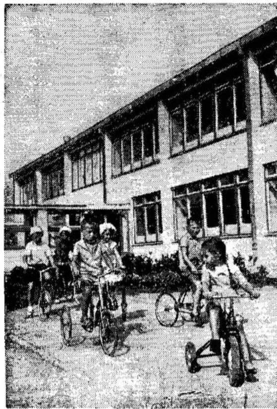
Naujosios Akmenės jauniausieji gyventojai — cemento gamyklos vaikų darželio auklėtiniai.

Tuo tarpu Kubos autoritetai paskelbė, kad atrasta ginklų ir amunicijos Kubos pajūryje. Ginklai ir amunicija — amerikoniški.