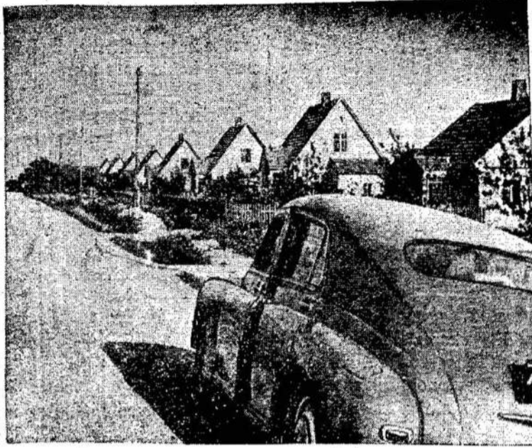
Kapsuko rajono Černiachovskio vardo kolūkio gyvenvietė.

Marksizmas suteikia pagrindines žinias, bet marksisto uždavinys mokėti veikti, apsiginklavus tomis žinomomis, visokiomis situacijose. Tas ir yra pagrindinė priežastis, kad ne visi marksistai vienodai orientuojasi, vienodai galvoja ir vienodai elgiasi.