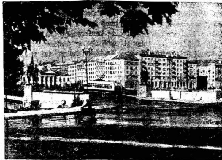
Prie tilto, jungiančio Vilniaus centrą su Dzeržinskio rajonu (buvusiu Kalvarijos).