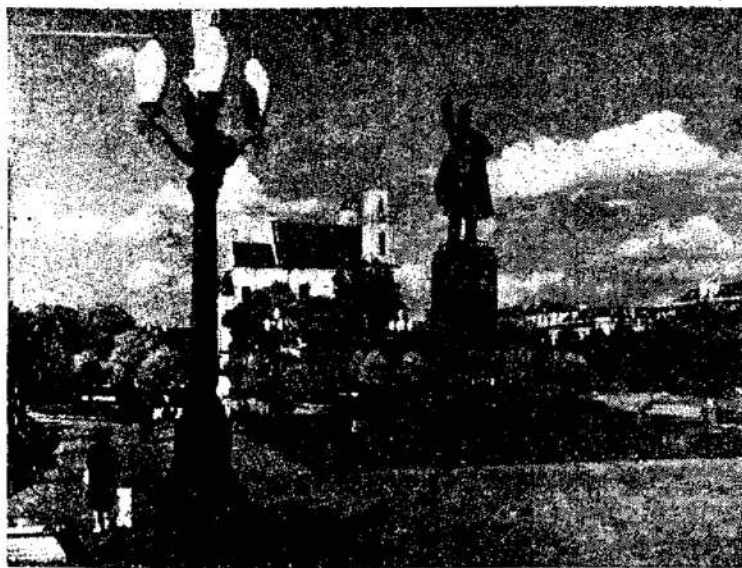
Lenino aikštė Vilniuje

HAMILTON. — Šiaurės konfencijoj socialinės pagalbos reikalais buvo iškelta, kad 250,000 fermerių gyvena gaudami $600 į metus.