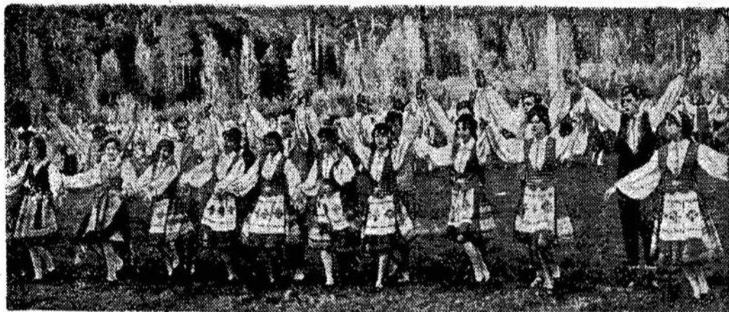
Vilniaus miesto XI dainų šventė, įvykusi gegužės 23 d. Vingio parke.