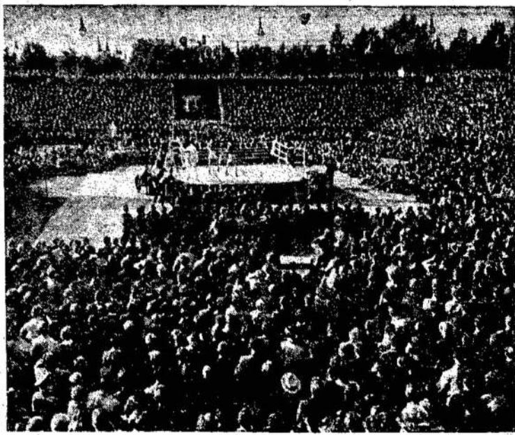
Kauno "Žalgirio" žaidimų stadionas. Čia vyksta bokso rungtynės ir kiti sporto įvykiai.

Liepos 18 ir 19 dienomis Lietuvoje vyko didelės šventinės iškilmės. Buvo apvaikščiujama 20-ties metų sukaktis, kai Lietuva buvo išvaduota iš hitleri-