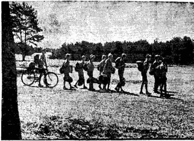
Turistai žygiuoja Anykščių apylinkėmis