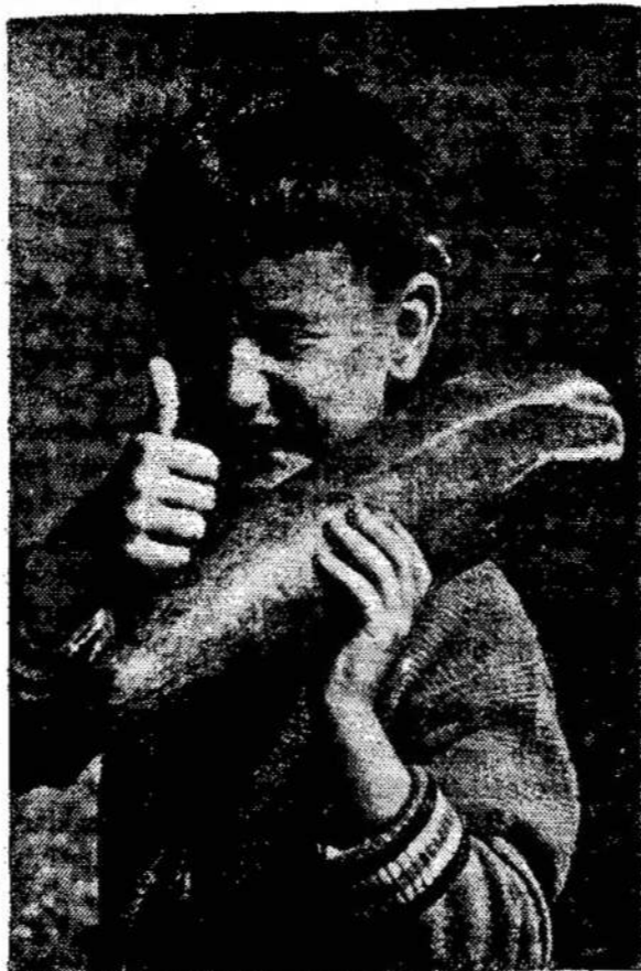
Tai bent agurkėlis

LONDON. — Vakarų Europos laikraščiai plačiai rašo ir balsiais vaizdais piešia Niujorko Harlemo riaušes, kurios užtruko kelias dienas.