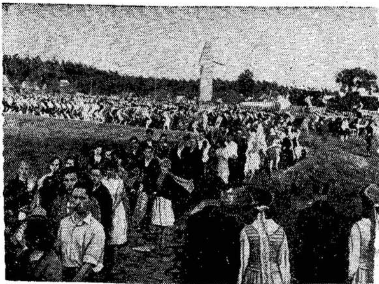
Tarybų Lietuvos darbo žmonės pagerbia Pirėiupio aukų atminimą. Nuotraukoje: padedami vainikai.

DETROIT. — Jau devinta diena eina dviejų Detroito laikraščių darbininkų streikas.