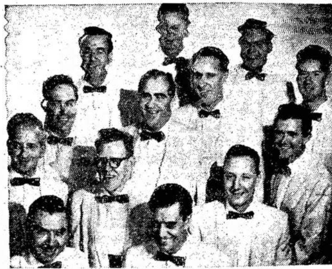
"Carl Topscott Singers", žinomi kaip "12 vyrų, kurie mėgsta dainuoti". Juos galima girdėti sekmadienį vakarais.

Jeigu nebūtų daroma nieko, tai greitai turėtume krizį, neramumus, kovas ir visa kita, kaip ir praityje. Yra juk nemažai tokių šalių, kur išnaudotojai nieko nedarė darbo žmonių būvio pagerinimui. Tenai eina visokios kovos, neramumai.