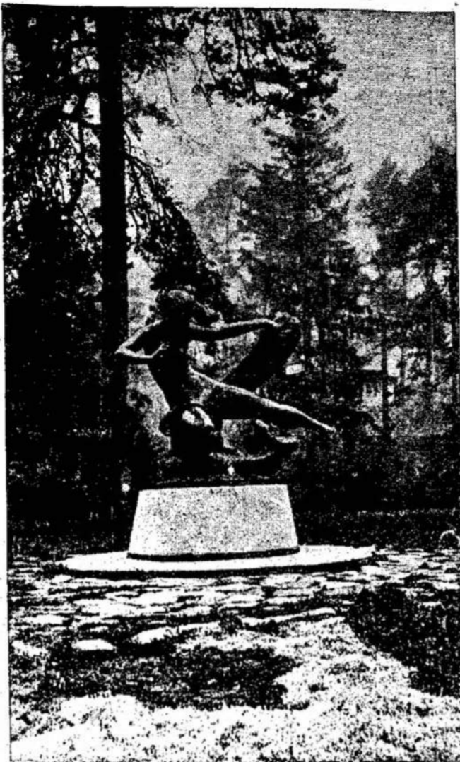
Eglė — žalčių karalienė Palangos parke. Tai kauniečio skulptoriaus Roberto Antinio kūrinys.