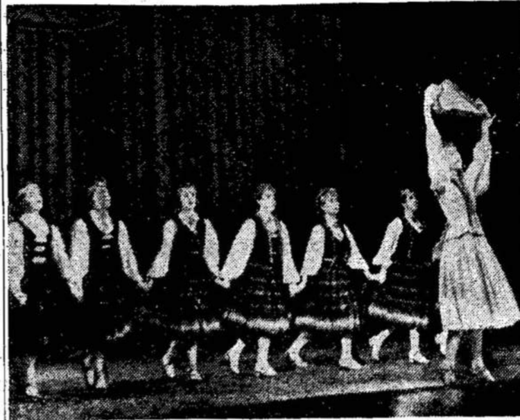
Vilniaus profesinių sąjungų kultūros rūmų šokių ratelis atlieka šokį "Taikos kanklės".

Išlaidos, kurios susidaro išlaikant Liaudies Balsą, aišku nemažos, bet lyginant su kitomis, kurias mes padarome savo malonumui, yra nedidelės. O nauda iš Liaudies Balso yra labai didelė. Gyvenimas be dvasinio peno būtų labai tuščias. Tad pirmą kartą LB reikalus vajaus metu.