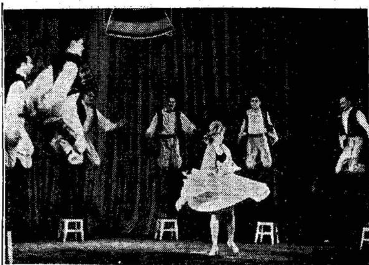
Kauno miesto profesinių sąjungų kultūros rūmų šokių kolektyvas atlieka vengrų liaudies šokį.

Taipgi buvo svarstomas ir Draugijos vajeus reikalas. Bet kaip žinome, tarpe senosios kartos gauti naujų narių beveik neįmanoma. Todėl Draugijos