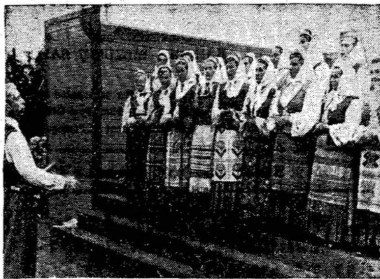
Simonių moterų choras

Bene ryškiausiai šitokių pranašavimų kilmė matyti iš knygutės 1922 m. laidos. Tada pirmą kartą buvo išspausdinti nežinia kieno nesenai sukurti "Vienuolio Johaneso pranašavimai apie pradžią, bėgį ir pabaigą didžiojo ir baisiojo 1914-1914 metų karo". Gera buvo pranašauti, kai karas jau buvo praėjęs. Knygutės leidėjai, suprantama, negalėjo prisipažinti autoriais ar nurodyti tų pranašysčių tikrąjį kūrėją, beliko sugalvoti, kad jos parašytos 17-tame amžiuje tūlo Paryžiaus vienuolio Johaneso. Nesunku suprasti šitų pranašysčių alegorinę prasmę. Antai,