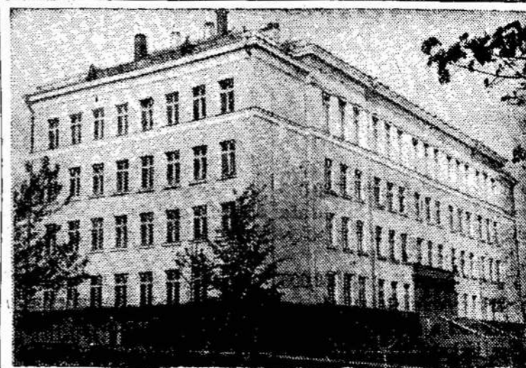
Kupiškio vidurinė mokykla

Taip tai abar stovi Kennedžio nužudymo klausimas. Kuri pusė teisinga, gal tik istorija patvirtins, jeigu tai bus galima.