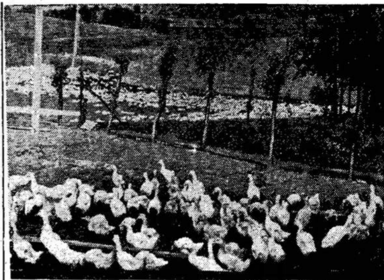
Alytaus rajono "Volungės" kolūkio paukščių augintojai gali pasididžiuoti stambia ančių ferma, iš kurios jie gauna didelį pelną.