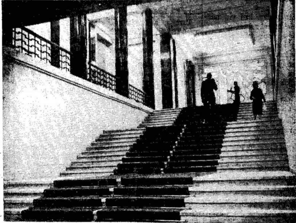
Respublikinės bibliotekos Vilniuje vestibulis