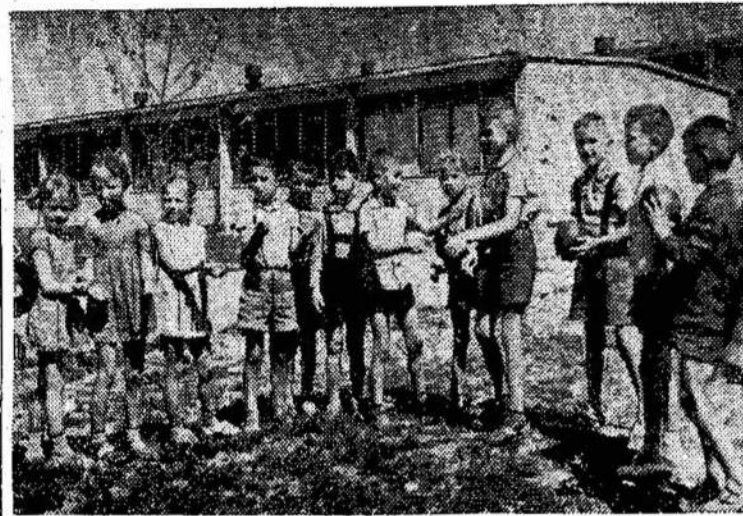
Šie gražučiai berniukai ir mergaitės yra Vilkaviškio vaikų darželio auklėtiniai.

MASKVA. — Proga 19-kos metų susiorganizavimo Albanijos liaudies respublikos, Tarybų Sąjunga pasiuntė jai pasveikinimą. Pasveikinime, greta likėjimų, sakoma, kad "Tarybų Sąjunga ir kitos socialistinės šalys darbuosis už tai, kad Albanija užimtų vietą socialistinių valstybių šeimoje". Kaip Albanija tai reaguos, dar nežinia.