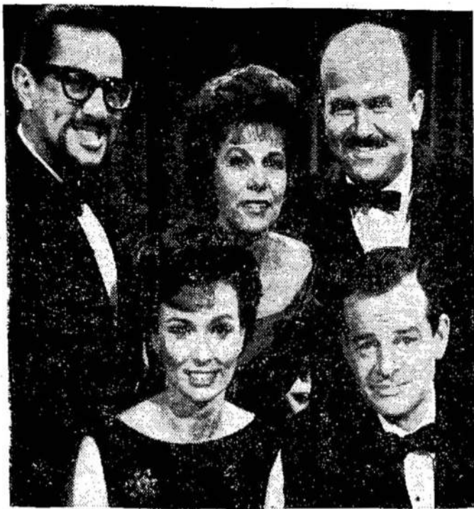
Sekmadeniais ant Kanados televizijos būsna programa pavadinimu "Flashback", prisimenanti praeitį. Nuotraukoje matote jos dalyvius.

Ciklonas padaręs Ceylone nuostolių už $40,000,000. Tūkstančiai šeimų liko be namų.