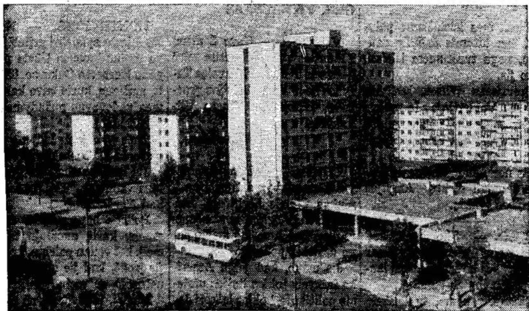
Vilniaus miesto pakraštys, kur nyksta mediniai namai, o jų vietoj dygsta nauji.

Išankstiniais duomenimis, iki 1965 metų pabaigos pensijas pradės gauti apie 140 tūkstančių Lietuvos kolūkiečių. Žemdirbių socialiniam aprūpinimui šiais metais išskirta 16 milijonų rublių valstybinių ir kolūkių lėšų.