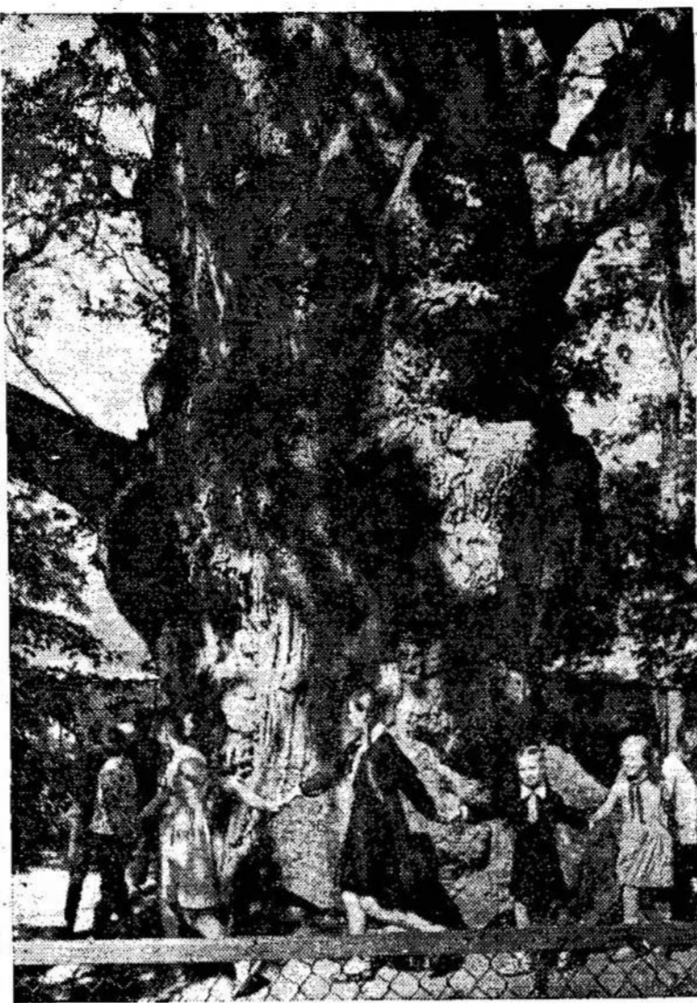
Lietuvos girių galiūnas Stelmužės ažuolas tebestovi tvirtas.

NEW YORK. — Kolumnistas, rašytojas ir komentatorius Walter Lippmann čia pareiškė, kad pasaulis nebus sutvarkytas ir sutaisytas komunizmo nugalėjimu, bet mokslo išsiplėtojimu.