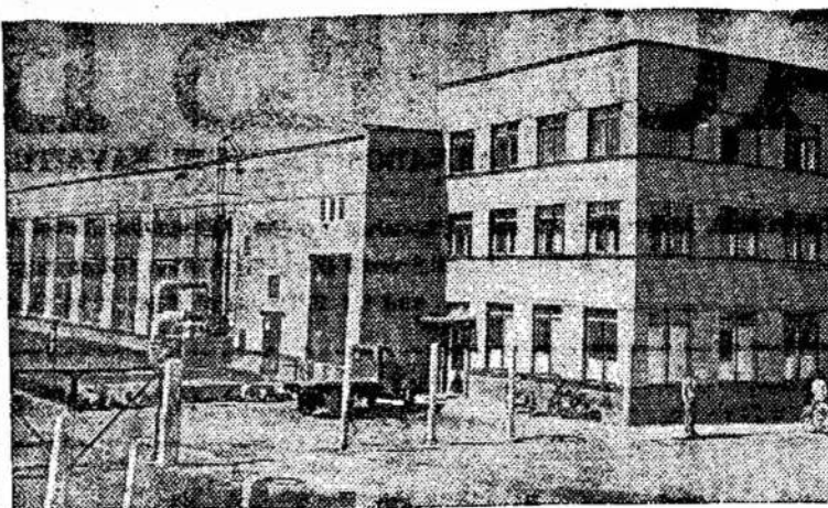
Žemės ūkio mašinų gamykla Radviliškyje

SAIGON. — Vienas žymus budistų lyderis viešai pradėjo reikalauti, kad amerikiečiai išsikraustytų iš Pietinio Vietnamo.