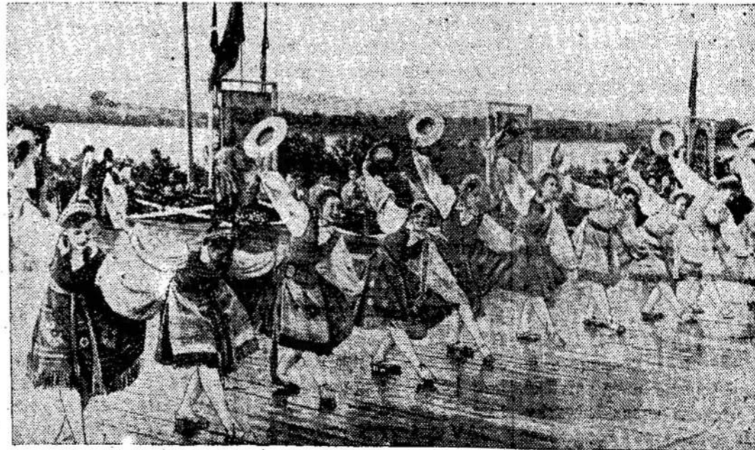
Žemaitijos jaunimas šoka prie Platelių ežero

A. Keršys, P. Petrulis, P. Keršulis, A. Greibus 1205 CHURCH AVE. PO. 8-6679 VERDUN, QUE.