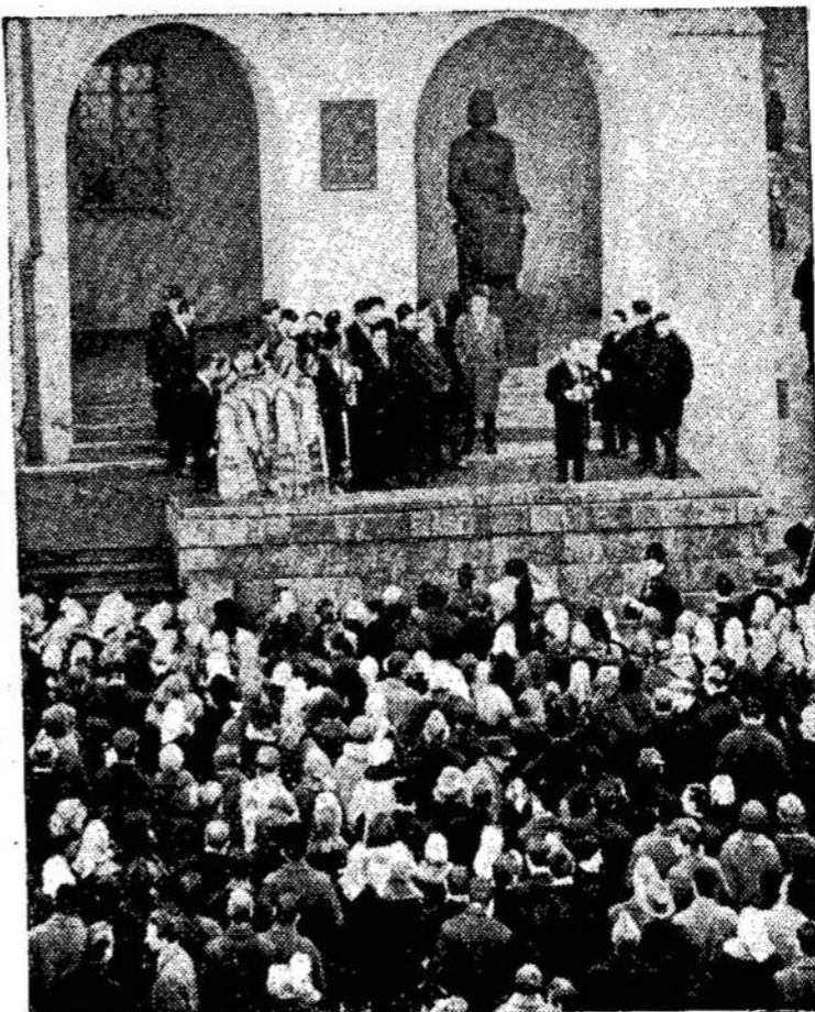
Gruodžio mėn. 26 dieną Vilniaus valstybinio universiteto centrinė rūmų nišoje buvo iškilmingai atidengta Kristijono Donelaičio statula. Nuotraukoje matome bendrą iškilnių vaizdą.