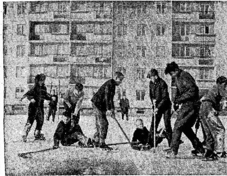
Sporto aikštelė naujame gyvenamųjų namų kvartale Vilniuje.

Verkšlenimai apie automaciją, sužiniai ar ne, nori ištelinti nedarbo buvimą, šios sistemos nesugebėjimą pašalinti ne-