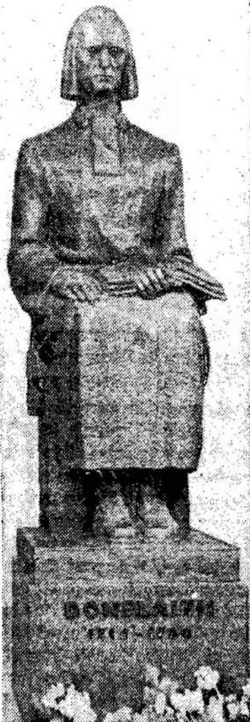
Kristijono Donelaičio statula, sukurta žinomo lietuvių skulptoriaus Konstantino Bagdono.

Liaudies Balsas, 160 Claremont St., Toronto 3, Ont. Canada.