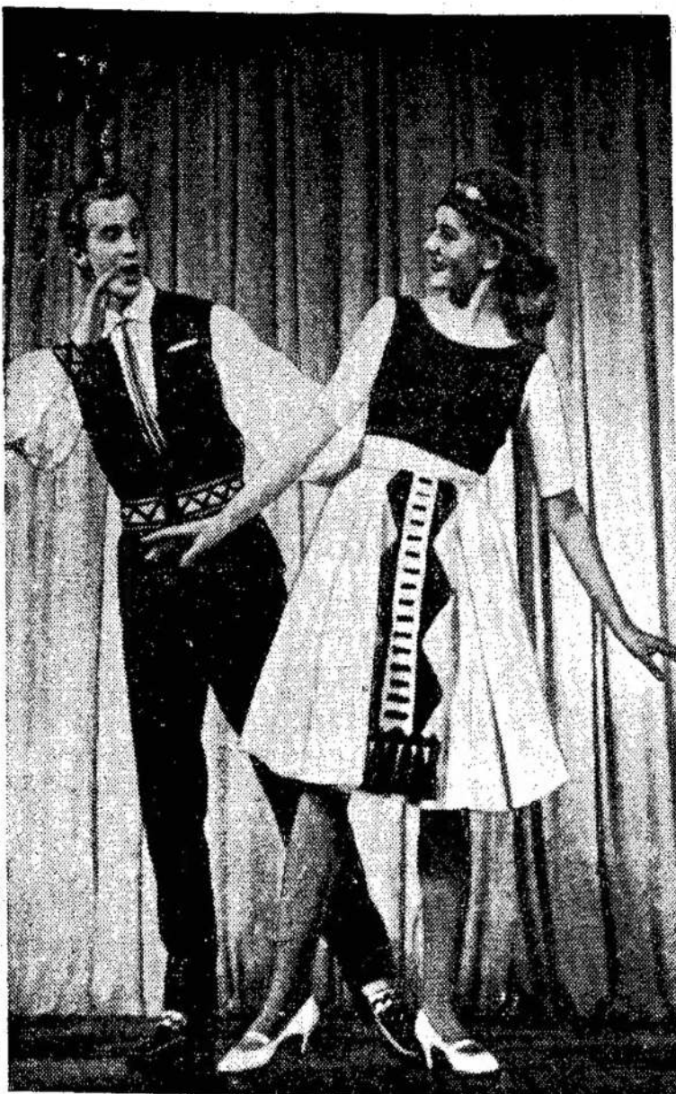
Sie dailūs jaunieji šokėjai šoka naują lietuvišką šokį “Ku-ku”. Jį sukūrė įžymus Lietuvos choreografas Juozas Lingys.