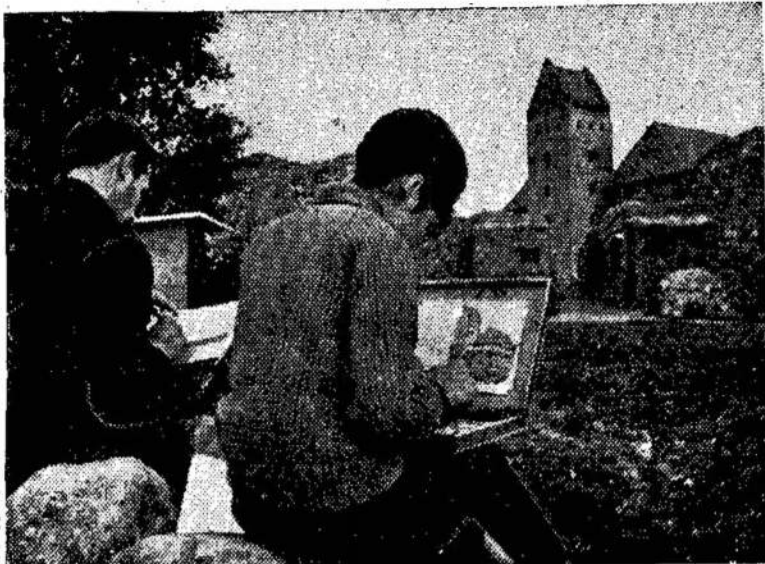
Trakai — dailininkų mylima vieta.

Amerikiečiai degina krūmus, miškus, skleidžia dujas, kurios vienodai liečia ir civilinius žmones. Taip tai kraštas naikinamas, žmonės žudomi. Tai necivilizuota, nekrikščioniška! Bet Jungtinių Valstijų karo vanagai verčia vyriausybę eiti toliau, bombarduoti didžiuosius šiaurės Vietnamo miestus. Grumoja net atominėmis bombomis, jeigu kiniečiai stotų talkon šiaurės Vietnamui apsiginti. Baisu! Baisu!